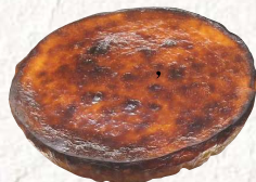
◆ 函館焦がしチーズケーキ .....2,000円より