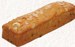
◆ フルーツケーキ .....2,250円より