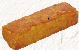
◆ オレンジケーキ .....1,750円より