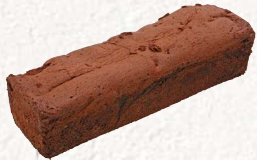
◆ チョコレートブラウニー .....2,050円より

函館国際ホテルのお引き物もご用意いたしております。担当者までお気軽にご相談ください