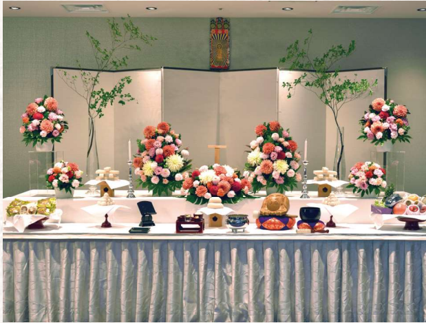
上記写真は70,000円プラン